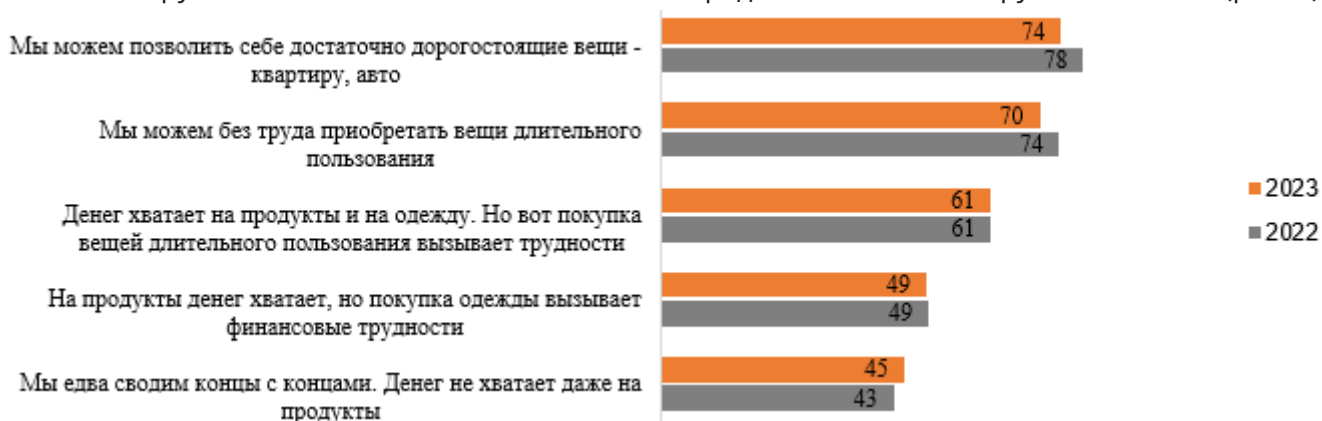
Рисунок 3 - Доля населения, удовлетворенных условиями для занятий физической культурой и спортом в зависимости от потребительского статуса (данные за 2022 и 2023 год, %)

Аналогично, уровень дохода напрямую связан с уровнем удовлетворенности доступными условиями. 8 из 10 человек с высоким уровнем дохода довольны своими возможностями для занятий физической культурой и спортом, среди наименее обеспеченных слоев вдвое меньше – только 4 из 10 удовлетворены имеющимися возможностями. В 2023 году эти параметры несколько снизились среди обеспеченных групп и остались почти без изменений среди менее богатых групп населения (рис. 3).